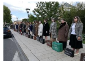
Le spectacle „În Zorii dictatorilor” – Cluj, Aiud et Vichy