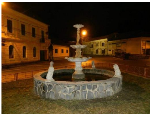
Centre Hida - Bâtiments juifs