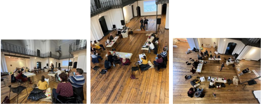
C.A.R.M.E. – mise en route

Travail, projets, échanges, amitié mais aussi mémoire et histoire