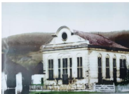
La Synagogue Hida ( n'existe plus)