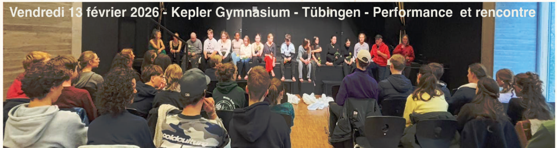
Vendredi 13 février 2026 - Kepler Gymnasium - Tübingen - Performance et rencontre

Weder belehrend noch bloß beobachtend versteht sich dieses temporäre Medium als Raum für Reflexion, Austausch und vor allem Engagement. Es ist ein Ort, an dem junge und ältere Menschen gemeinsam lernen, kritisch zu denken, respektvoll zu diskutieren und ihre Rolle als Bürgerinnen und Bürger im digitalen Raum aktiv wahrzunehmen. Denn verstehen heißt besser entscheiden – und entscheiden heißt, die Kraft zum Handeln zu haben.