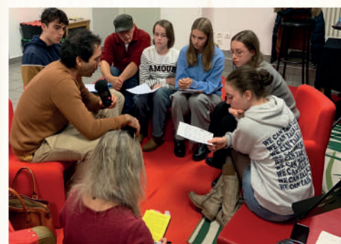
Rencontre et interview de Jean Lou Fourquet par les jeunes de l'institution Saint Joseph avec l'aide de Juliette Moyet de Radio Coquelicot Médiathèque de Cusset 28 novembre 2025

Cum, atunci când ai doar 30 de minute de pregătire, interviezi o persoană care vorbește cu propoziții la fel de complexe precum ? Un interviu este un tip de interviu în care un jurnalist interviează o persoană cu intenția de a face public conținutul. Acest lucru necesită pregătire, un minim de abilități și a fi destul de confortabil să vorbești. Obiectivul este de a oferi cunoștințe despre un subiect, o personalitate sau un eveniment. Facem parte dintr-un grup de studenți implicați în proiectul Fake news și cetățenie digitală datorită căruia experimentăm o educație media foarte cuprinzătoare: contribuții de cunoștințe ale profesioniștilor, întâlniri ale jurnaliștilor din presa scrisă, web și radio, expoziții și istoria jurnalismului prin figura lui Albert Londres. În acest context, am pregătit interviul cu Jean Lou Fourquet.