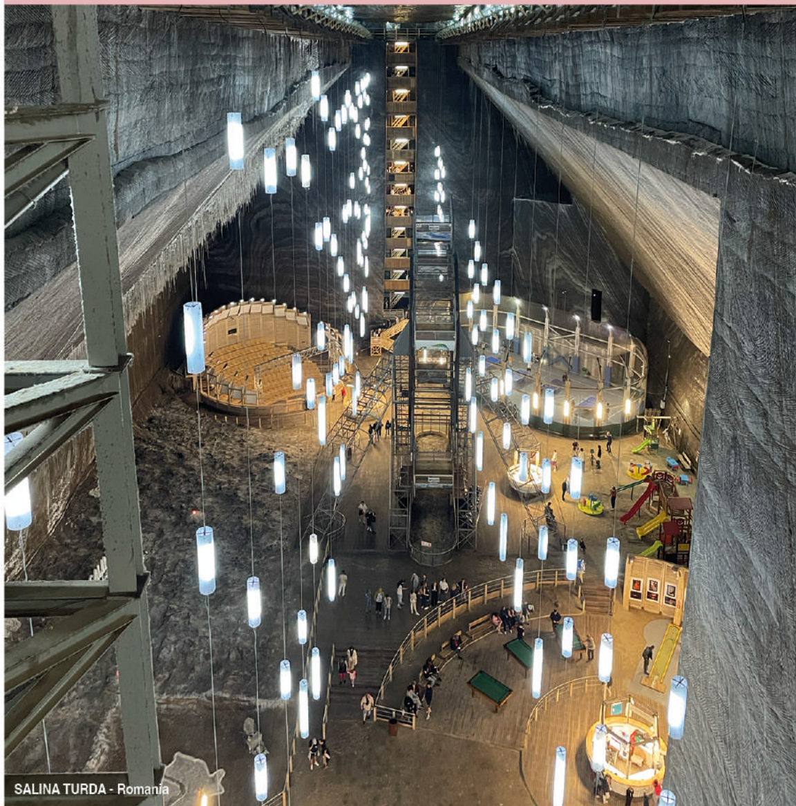
SALINA TURDA - Romania

Das eigentliche Problem liegt also auch in der fehlenden Regulierung dieser Systeme. Für die Plattformen ist es am profitabelsten, Inhalte zu fördern, die starke Reaktionen hervorrufen – oft mit negativen Folgen für Individuen und Gesellschaft, insbesondere für die psychische Gesundheit. Diese Dynamik wird durch Empfehlungsalgorithmen zusätzlich verstärkt.